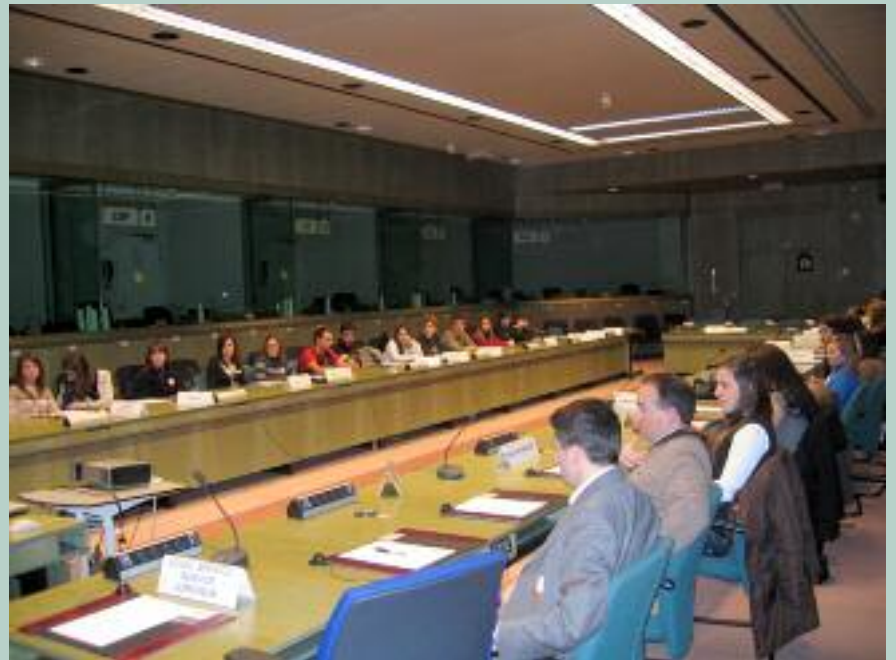
Ikasle guztiek Europako Kontseilua ezagutzeko aukera izan zuten

EBko Parlamentuak botere legegilearen erdia osatzen du. Bost urtean behin, Europako herritarrek Parlamentuko 785 kideak hautatzen dituzte. Nahiz eta herrikideen arabera aukeratzeko dituzten, biltzarrean alderdi