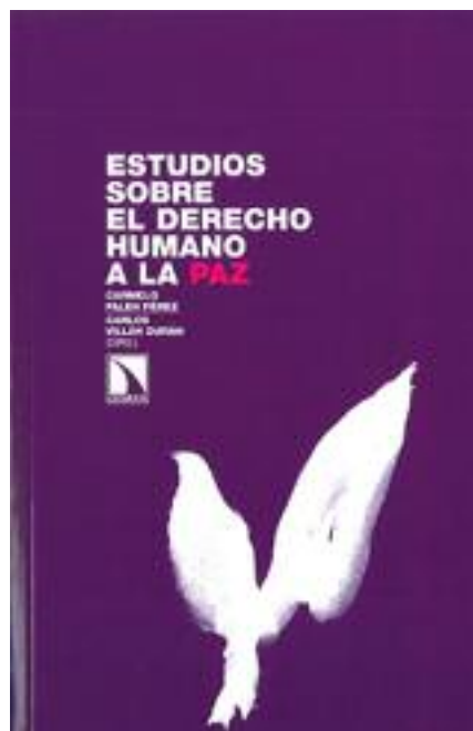
"Estudio sobre el derecho humano a la paz" liburuaren azala

"Estudios sobre derecho Humano a la Paz" liburua, jadanik publikoaren esku dago liburutegietan eta baita Catarata argitaletxearen webgunean ere.