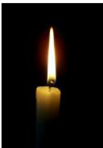
Biktimen oroimena bizirik mantentzea aldarrikatu dute

ETA, GAL eta Batallón Vasco Españolak jendea hil zuten 49 puntuak bisitatu dituzte Bizkaiko hiriburuan. 63 pertsona hil dituzten 49 leku ezberdi-