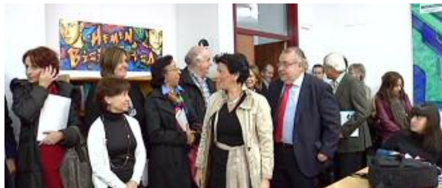
Celaá Barakaldon egindako aurkezpenean

“Bakegunea eraiki nahi izan dugu, benetakoa eta birtuala eta elkarrekin bizitzeko behar ditugun baloreak eta dohainak nabarrenduko ditudu”, gaineratu du sailburuak.