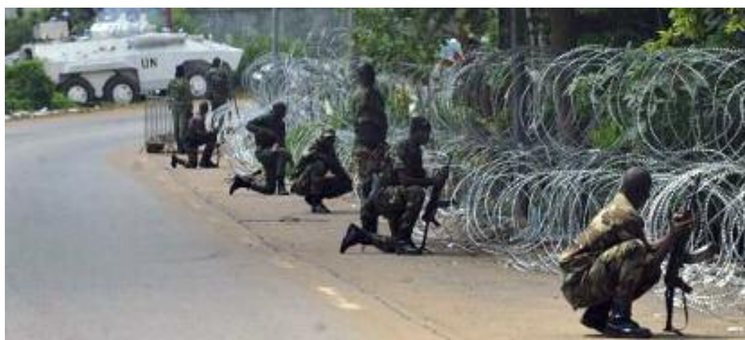
Biktimen oroimena bizirik mantentzea aldarrikatu dute

boren aldekoak armak erosten ari direla ohartarazi du.