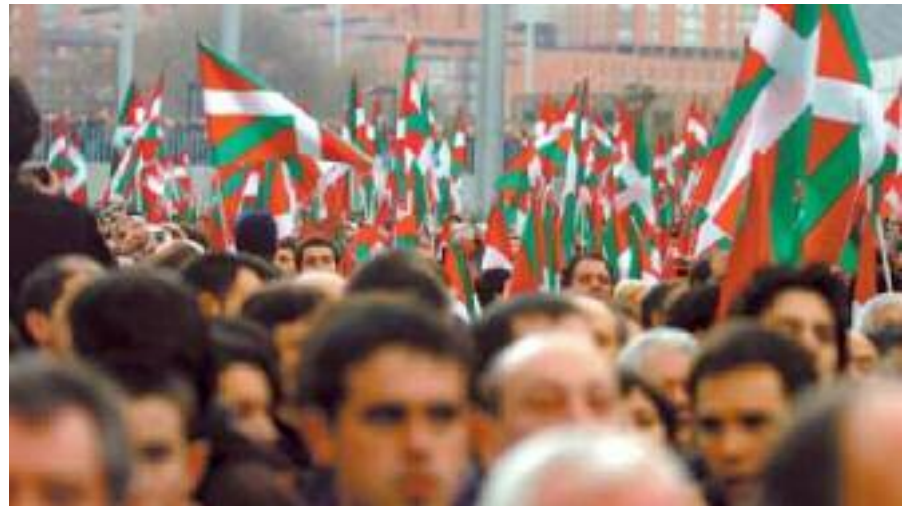
Ezker abertzaleak hainbat mobilizazio aurrera eraman dituzte azken urteetan

Era berean, Abrilek Gernikako Akordioak duen garrantzia nabarmendu du, baina datorren urteko udal eta foru hauteskundeekin harremanik ez duela azaldu du. Abrilen arabera, «bat egiteko baldintzarik ez» dago egun; hala ere, ez du baztertu hauteskundearen ostean subiranista eta abertzaleen arteko el-