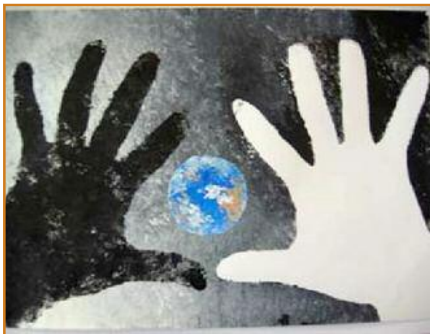
Giza Eskubideek Hezkuntzan ere eragina dute

Aurkezten dugun jardunaldia, Bakerako eta Giza Eskubideetarako Hezkuntzako Euskal Plana (2008-2011) birformulatzen duen Bizikidetzaren demokratikoa eta indarkeriaren deslegitimazioa (2010-2011) dokumentuan barrukoa, Justizia eta Herri Administrazio Sailaren ekintzen programen baitan dago.