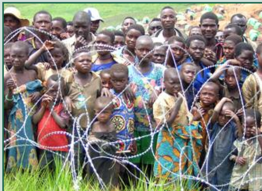
Nazioartean laguntza humanitaria ere eskaintzen dute