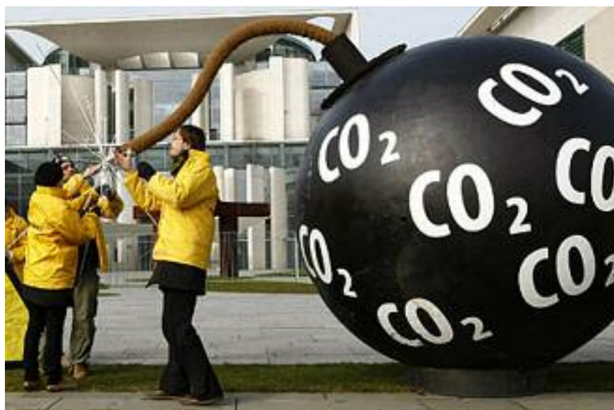
Activistas protestan en contra de las emisiones de CO2

El problema radica en que algunos atuneros, incluso, han sido acosados en más de una ocasión. Todos los ataques se han producido a más de 400 millas de las aguas internacionales de la costa de Somalia.