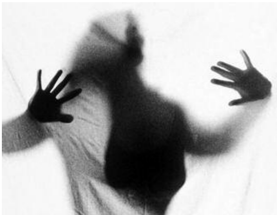
Azaroaren 25ean emakumeenganako bortxakeriaren aurkako eguna ospatu zen

Mugarik Gabek, genero berdintasuna aldarrikatzen duten beste elkarte edo talde batzuen artean,