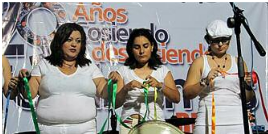
El Salvadoreko Las Dignas kolektiboaren ordezkariak