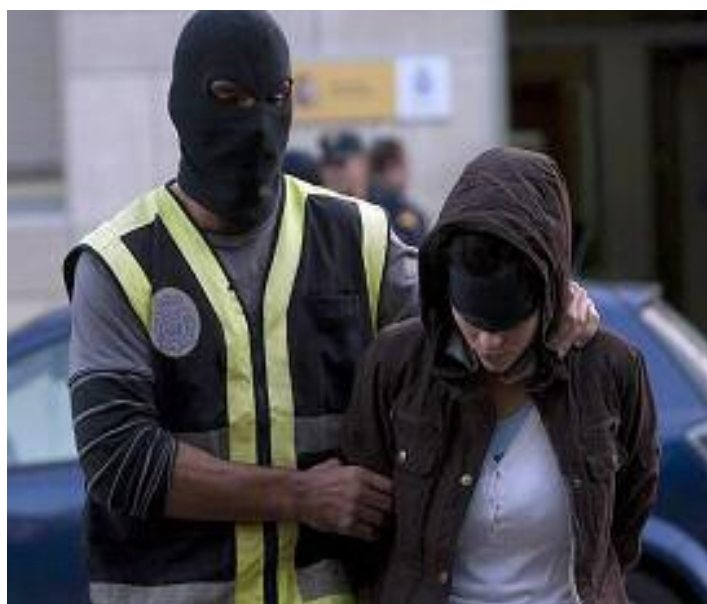
Biktimen oroimena bizirik mantentzea aldarrikatu dute

tera eramanarazteak ez du erakusten Justiziaren funtzionamendua ona denik".