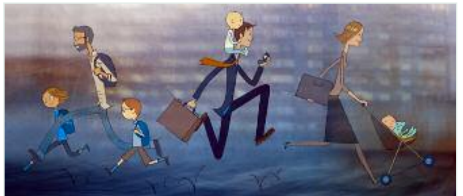
Emakumeen eta gizonen arteko berdintasuna ez da oraindik erabatekoa

Erakundeen lana: Badira hogeita urte baino gehiago herri erakundeek emakumeen eta gizonen berdintasunaren alde lan egiten hasi zirenetik. Berdintasun politiketan haiek duten eskarmentua EAE leku faboragarrian ipintzen dute Gizonduz-en moduko ekimen berritzaileak garatzeko. Gainera, ugariak dira teoriaren ikuspegian sexuen arteko berdintasunaren alde agertzen diren gizonak.