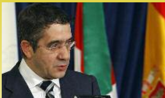
Nahiz eta Lópezen jarrera baikorra izan, ez dago erabat ziur

Euskal gizarteari dagokionez, Lópezen ustez, biztanleek terrorismoari eta kale indarkeriari aurre egiteko "aurrerapauso garrantzitsua" eman dute. "Euskal gizarteak