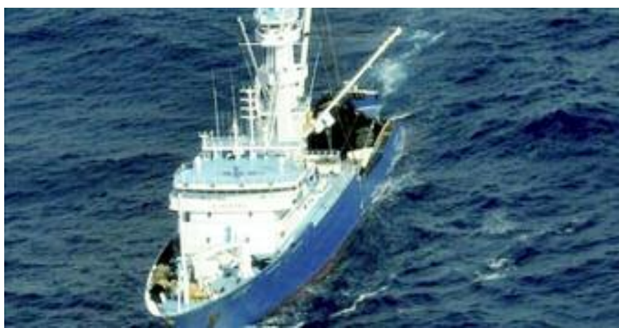
Las embarcaciones cada vez disponen de mayor seguridad a bordo

A lo largo de este último año más de la mitad de los atuneros que navegan en las aguas más peligrosas del planeta ha sufrido algún tipo de ataque o el acoso de los piratas somalíes.