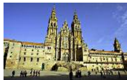
Aurtengo Foro Mundiala Santiago de Compostelan antolatuta da