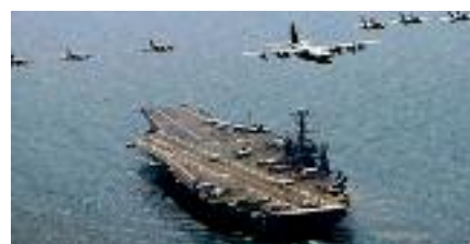
Maniobra militarrek itsaso horian

Hego Koreak Itsaso Horian beste maniobra militar batzuk egin ostean, Ipar eta Hego Korearen arteko tentsioak gora egin du berriro.