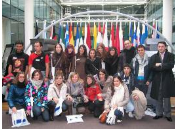
Zuzenbide Fakultateko ikasleak eta ekimenaren antolatzaile batzuk

Ostiraleko jardunaldiari dagokionez, azaroaren 26ko goizean taldeek banatuta jarraitu zuten; Zuzenbidekoek, kasu honetan, Europar Batzordea ezagutzeko aukera izan zuten; eta arratsalde horretan, talde biak batu ziren Europako Kontseilua bisitatzeko. Jardunaldia Lovaina hiriarren bisitare-