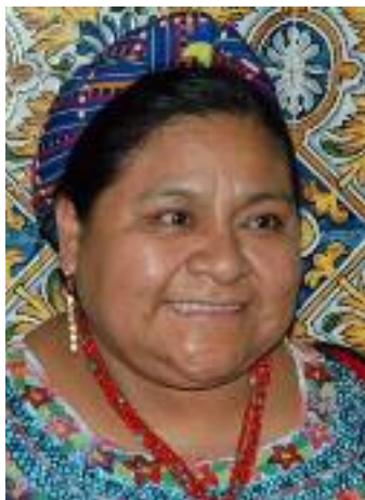
Rigoberta Menchú, giza eskubideen aldeko ekintzaile guatemalarra

1992an, Rigobertak Argentina bisitatu zuen, eta, bertan, Adolfo Pérez Esquivel ezagutu zuen (Nobel sariaren irabazlea izan zena); horren ondorioz, Menchú sari ospetsua lortzeko lehenengo urratsak eman zituen,